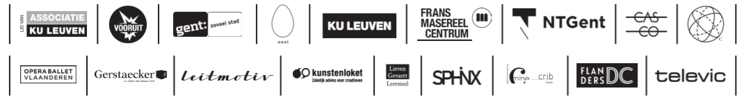
VIJL BART GEERTS, PALDIENENSTRAAT 70, 1000 BRUSSEL. GRAFISCH ONTWERP: CORNENRANDEL.BE • JANENRANDEL.BE

LUCA organiseert haar Showcase extra muros en gaat hiervoor een samenwerking aan met relevante culturele instellingen in de steden waar ze haar opleidingen organiseert. NEST wordt onze hoofdlocatie, maar we organiseren ook activiteiten op andere locaties.